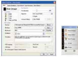
Avision Button Manager V2