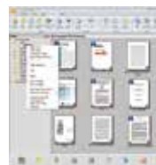
PaperPort SE 14 使用界面

Button Manager V2 提供你一個非常迅速又容易的方法來完成掃描的工作。只要輕輕按一下掃描器上的「Scan」按鍵，就可以完成文件的掃描，把紙張文件轉為 JPEG、BMP、TIFF、PDF 或 GIF 的圖檔格式，並且把圖檔直接連結到預設的檔案夾或應用軟體，例如，e-mail、印表機、或其他影像編輯應用軟體，簡化了繁雜的掃描工作。