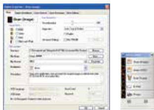
Avision Button Manager V2