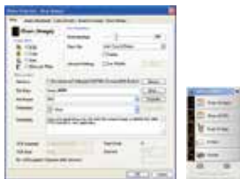
The Button Manager V2

Button Manager V2 提供你一个非常迅速又容易的方法来完成扫描的工作。 只要轻轻单击扫描仪上的「Scan」按钮，就可以完成文件的扫描，把纸张文件转为 JPEG、BMP、TIFF、PDF 或 GIF 的图档格式，并且把图档直接连接到预设的档案夹或应用软件，例如，e-mail、打印机、或其他影像编辑应用软件，简化了繁杂的扫描工作。