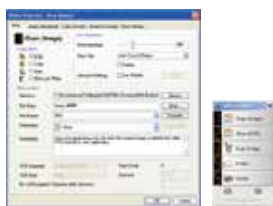
The Button Manager V2