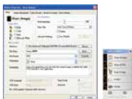
The Button Manager V2 main screen

Button Manager V2 提供你一个非常迅速又容易的方法来完成扫描的工作。只要轻轻单击扫描仪上的「Scan」按键，就可以完成文件的扫描，把纸张文件转为JPEG、BMP、TIFF、PDF或GIF的图档格式，并且把图档直接连接到预设的档案夹或应用软件，例如，e-mail、打印机、或其他影像编辑应用软件，简化了繁杂的扫描工作。