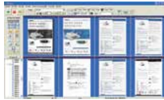
The AVScan X main screen

-A ferramenta inteligente para gerenciamento de documentos