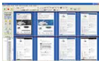
The AvScan X main screen

将文件影像化是管理数码文件的第一步。如果影像质量不好，可能会对储存或搜寻影像造成严重的问题，例如会降低文字的辨识(OCR)能力而进一步影响搜寻的结果，以及增加你需要重新扫描的时间。使用 AvScan X 来扫描文件，透过各种适当的设定，可以确保文件在扫描时，得到最佳的质量，并更有效地作进一步的处理。AvScan X 是一个智能型扫描文件及存盘的解决方案，它具有多种先进的功能，可以将文件数码化并将文件有效地转化为可搜寻的档案，方便日后的查询，是管理数码化文件最理想的工具。