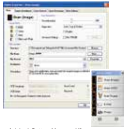
Avision's Button Manager V2

Button Manager V2 提供你一个非常迅速又容易的方法来完成扫描的工作。只要轻轻单击扫描仪上的「扫描」按键，就可以完成文件的扫描，把纸张文件转为JPEG、BMP、TIFF、PDF或GIF的图档格式，并且把图档直接连接到预设的档案夹或应用软件，例如，e-mail、打印机、或其他影像编辑应用软件，简化了繁杂的扫描工作。