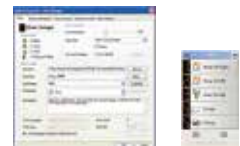
Avison Button Manager V2

Button Manager V2 提供你一個非常迅速又容易的方法來完成掃描的工作。只要輕輕按一下掃描器上的「Scan」按鍵，就可以完成文件的掃描，把紙張文件轉為JPEG、BMP、TIFF、PDF或GIF的圖檔格式，並且把圖檔直接連接到預設的檔案夾或應用軟體，例如，e-mail、印表機、或其他影像編輯應用軟體，簡化了繁雜的掃描工作。