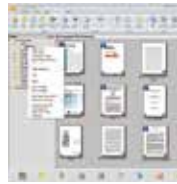
PaperPort SE 14 使用界面

PaperPort SE 14 是一個可以迅速將堆積如山的文件及照片數位化，並讓你迅速在網路上搜尋、使用及分享這些數位文件的軟體。有了 PaperPort SE 14，從此不需要在堆積如山的文件中，辛苦地找尋你要的文件了。PaperPort SE 14讓文件的數位化變得輕鬆又容易，因為它可以迅速地多頁的文件轉成非常普遍的可攜式文件格式 PDF、或JPEG、及其它圖檔格式等，並讓你將圖檔直接用拖拉的方式連結到其他的應用軟體，非常方便好用而不需花額外的時間學習，是家用與小型辦公室影像處理的最佳選擇！