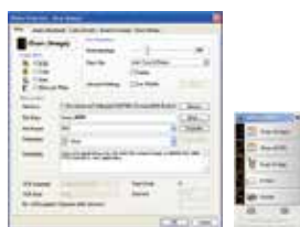
The Button Manager V2

Button Manager V2 提供你一个非常迅速又容易的方法来完成扫描的工作。只要轻轻单击扫描仪上的「Scan」按键，就可以完成文件的扫描，把纸张文件转为 JPEG、BMP、TIFF、PDF 或 GIF 的图档格式，并且把图档直接连接到预设的档案夹或应用软件，例如，e-mail、打印机、或其他影像编辑应用软件，简化了繁杂的扫描工作。