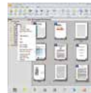
PaperPort SE 14 使用界面

PaperPort SE 14 是一個可以迅速將堆積如山的文件及照片數位化，並讓你迅速在網路上搜尋、使用及分享這些數位文件的軟體。有了 PaperPort SE 14，從此不需要在堆積如山的文件中，辛苦地找尋你要的文件了。PaperPort SE 14讓文件的數位化變得輕鬆又容易，因為它可以迅速地多頁的文件轉成非常普遍的可攜式文件格式 PDF、或 JPEG、及其它圖檔格式等，並讓你將圖檔直接用拖拉的方式連結到其他的應用軟體，非常方便好用而不需花額外的時間學習，是家用與小型辦公室影像處理的最佳選擇！