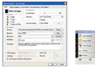
Avision Button Manager V2

Button Manager V2 提供你一個非常迅速又容易的方法來完成掃描的工作。只要輕輕按一下掃描器上的「Scan」按鍵，就可以完成文件的掃描，把紙張文件轉為JPEG、BMP、或 GIF 的圖檔格式，並且把圖檔直接連結到預設的檔案夾或應用軟體，例如，e-mail、印表機、或其他影像編輯應用軟體，簡化了繁雜的掃描工作。