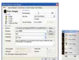
The Button Manager V2

Button Manager V2 提供你一个非常迅速又容易的方法来完成扫描的工作。只要轻轻单击扫描仪上的「Scan」按键，就可以完成文件的扫描，把纸张文件转为JPEG、BMP、TIFF、PDF或GIF的图档格式，并且把图档直接连接到预设的档案夹或应用软件，例如，e-mail、打印机、或其他影像编辑应用软件，简化了繁杂的扫描工作。