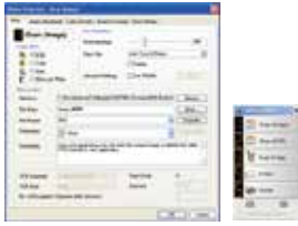
The Button Manager V2

Button Manager V2 提供你一个非常迅速又容易的方法来完成扫描的工作。只要轻轻单击扫描仪上的「Scan」按键，就可以完成文件的扫描，把纸张文件转为 JPEG、BMP、TIFF、PDF 或 GIF 的图档格式，并且把图档直接连接到预设的档案夹或应用软件，例如：e-mail、打印机、或其他影像编辑应用软件，简化了繁杂的扫描工作。