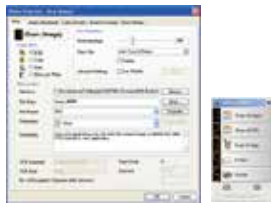
The Button Manager V2

Button Manager V2 提供你一个非常迅速又容易的方法来完成扫描的工作。 只要轻轻单击扫描仪上的「Scan」按钮，就可以完成文件的扫描，把纸张文件转为JPEG、BMP、TIFF、PDF或GIF的图档格式，并且把图档直接连接到预设的档案夹或应用软件，例如，e-mail、打印机、或其他影像编辑应用软件，简化了繁杂的扫描工作。