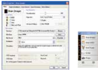
Avision Button Manager V2

Button Manager V2 提供你一個非常迅速又容易的方法來完成掃描的工作。只要輕輕按一下掃描器上的「Scan」按鍵，就可以完成文件的掃描，把紙張文件轉為 JPEG、BMP、或 GIF 的圖檔格式，並且把圖檔直接連結到預設的檔案夾或應用軟體，例如，e-mail、印表機、或其他影像編輯應用軟體，簡化了繁雜的掃描工作。