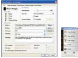
The Button Manager V2 main screen

Button Manager V2 提供你一个非常迅速又容易的方法来完成扫描的工作。 只要轻轻单击扫描仪上的「Scan」按键，就可以完成文件的扫描，把纸张文件转为JPEG、BMP、TIFF、PDF或GIF的图档格式，并且把图档直接连接到预设的档案夹或应用软件，例如：e-mail、打印机，或其他影像编辑应用软件，简化了繁杂的扫描工作。