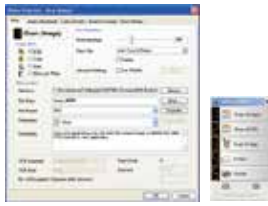
The Button Manager V2

Button Manager V2 提供你一个非常迅速又容易的方法来完成扫描的工作。只要轻轻单击扫描仪上的「Scan」按键，就可以完成文件的扫描，把纸张文件转为 JPEG、BMP、TIFF、PDF 或 GIF 的图档格式，并且把图档直接连接到预设的档案夹或应用软件，例如：e-mail、打印机、或其他影像编辑应用软件，简化了繁杂的扫描工作。