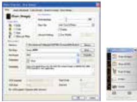
The Button Manager V2

Button Manager V2 提供一个非常迅速又容易的方法来完成扫描的工作。只要轻轻单击扫描仪上的「Scan」按钮，就可以完成文件的扫描，把纸张文件转为JPEG、BMP、TIFF、PDF或GIF的图档格式，并且把图档直接连接到预设的档案夹或应用软件，例如，e-mail、打印机、或其他影像编辑应用软件，简化了繁杂的扫描工作。