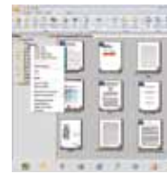
PaperPort SE14 Vollbildanzeige

PaperPort SE 14 ist das von Nuance sorgfältig entwickelte und geprüfte Anwendungslösung für die Nutzung im Büroalltag und häuslichen Gebrauch. Geeignet zum Scannen, zum Teilen und zum Organisieren von Dokumenten bietet das PaperPort SE 14 mit wenigen Schritten den Zugriff auf Ihre Ablage unwesentlich ihren Standortes - sei es mobil über die App-Anbindung oder an ihrem festen Arbeitsplatz.