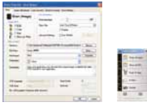
Button Manager V2 Vollbildanzeige

Das Button Manager V2 erleichtert das Scannen und Verschicken von Bilddateien an favorisierte Speicherablagen mit einem Tastendruck. Die neue Innovation ist kompatibel zu weiteren Anwendungen wie das Google Docs, Microsoft SharePoint und der FTP-Server. Das iScan erkennt mithilfe des OCR (Optical Character Recognition) den Scaninhalt und garantiert optimale Benutzerbedienung.