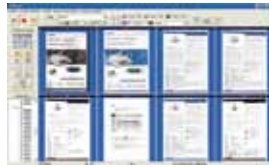
AVScan X Vollbildanzeige

Das intelligente Dokumenten Management Tool