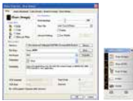
The Button Manager V2 main screen

Button Manager V2 提供你一個非常迅速又容易的方法來完成掃描的工作。只要輕輕按一下掃描器上的「Scan」按鍵，就可以完成文件的掃描，把紙張文件轉為 JPEG、BMP、TIFF、PDF 或 GIF 的圖檔格式，並且把圖檔直接連接到預設的檔案夾或應用軟體，例如：e-mail、印表機、或其他影像編輯應用軟體，簡化了繁雜的掃描工作。