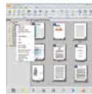
PaperPort SE 14 使用界面

PaperPort SE 14 是一個可以迅速將堆積如山的文件及照片數位化，並讓你迅速在網路上搜尋、使用及分享這些數位文件的軟體。有了 PaperPort SE 14，從此不需要在堆積如山的文件中，辛苦地找尋你要的文件了。PaperPort SE 14 讓文件的數位化變得輕鬆又容易，因為它可以迅速地多頁的文件轉成非常普遍的可攜式文件格式 PDF、或 JPEG、及其它圖檔格式等，並讓你將圖檔直接用拖拉的方式連接到其他的應用軟體，非常方便好用而不需花額外的時間學習，是家用與小型辦公室影像處理的最佳選擇！