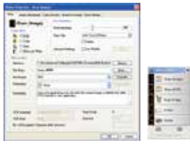
The Button Manager V2 main screen

Button Manager V2 提供你一个非常迅速又容易的方法来完成扫描的工作。 只要轻轻单击扫描仪上的「Scan」按钮，就可以完成文件的扫描，把纸张文件转为JPEG、BMP、TIFF、PDF或GIF的图档格式，并且把图档直接连接到预设的档案夹或应用软件，例如，e-mail、打印机、或其他影像编辑应用软件，简化了繁杂的扫描工作。