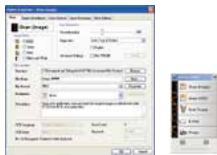
Avision Button Manager V2

Button Manager V2 提供你一个非常迅速又容易的方法来完成扫描的工作。只要轻轻单击扫描仪上的「Scan」按键,就可以完成文件的扫描,把纸张文件转为JPEG、BMP、TIFF、PDF或GIF的图档格式,并且把图档直接连接到预设的档案夹或应用软件,例如,e-mail、打印机、或其他影像编辑应用软件,简化了繁杂的扫描工作。