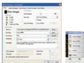
The Button Manager V2

Button Manager V2 提供你一个非常迅速又容易的方法来完成扫描的工作。 只要轻轻单击扫描仪上的「Scan」按键，就可以完成文件的扫描，把纸张文件转为JPEG、BMP、TIFF、PDF或GIF的图档格式，并且把图档直接连接到预设的档案夹或应用软件，例如，e-mail、打印机、或其他影像编辑应用软件，简化了繁杂的扫描工作。